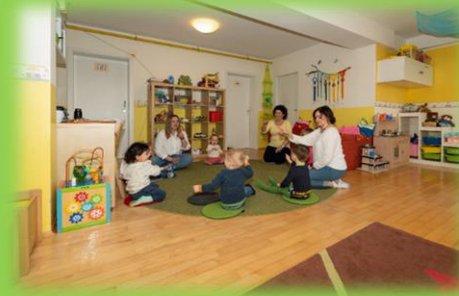
Bewegungs- und Turnraum